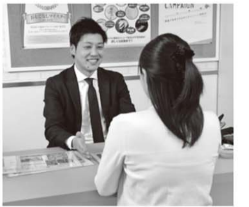
「安心のお部屋探し・お客様への感謝」がモットー

また先ほどの接客ランキングを見ると、入居者お一人お一人に対して、社員がきめ細かな対応をしてくれているようですね。限りなく、こうした社風は、今後も大切に守っていきたく思います。タウングループは創業から一貫して首都圏に特化した展開を続けており、現在の店舗数はタウンハウジングが63、アレップスが11となつています。今後はより地域に密着したサービスと情報提供を行うため、タウンハウジング100店舗、アレップス15店舗を達成することが当面の目標です。拠点の増加は、入居者募集や情報収集において有利だけでなく、退室後の補修をスピードアップし、物件が稼働しない期間を短縮するな