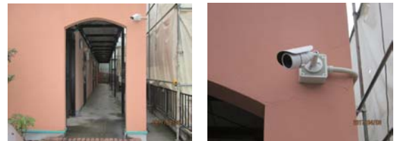
玄関側に設置した例

いて空き巣としては恰好のケースもありますので、こうした場所には目立つ位置に防犯カメラを設置するのがとても有効と言えます。