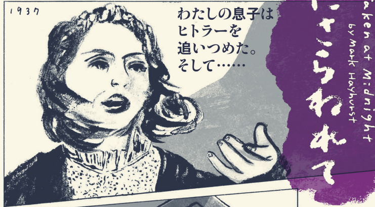
Taken at Midnight by Mark Hayhurst