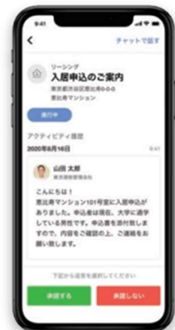
入居申込などの 様々な確認事項に対応

管理会社から送られてくる、入居募集／修繕／退去／契約更新に伴う様々な確認事項を、チャット画面にてワンクリックで返信できます。