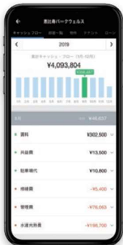
タイムリーでわかりやすい 収支報告

物件情報、テナント情報、収支状況など、あらゆる情報を一元管理。収支表はダウンロードや印刷も可能。必要に応じてPDF／Excelに出力して確定申告にも活用いただけます。