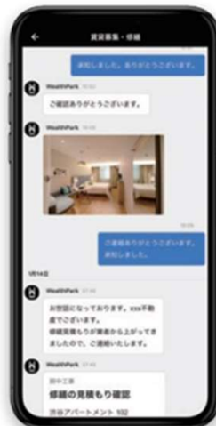
画像やファイルも 送受信可能

チャットなら、いつでもどこでも、手軽に管理会社と繋がれます。電話、郵送、メールと比べ、すれ違いや見逃しを防げます。