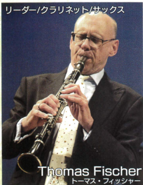
リーダー/クラリネット/サクソ